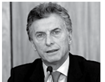
Presidente argentino Mauricio Macri