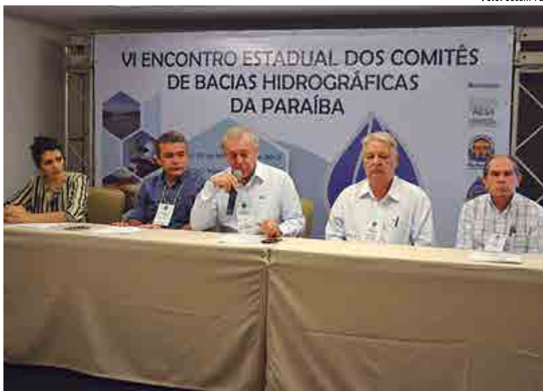
O monitoramento em tempo real foi apresentado ontem pela Agência Executiva de Gestão das Águas da Paraíba