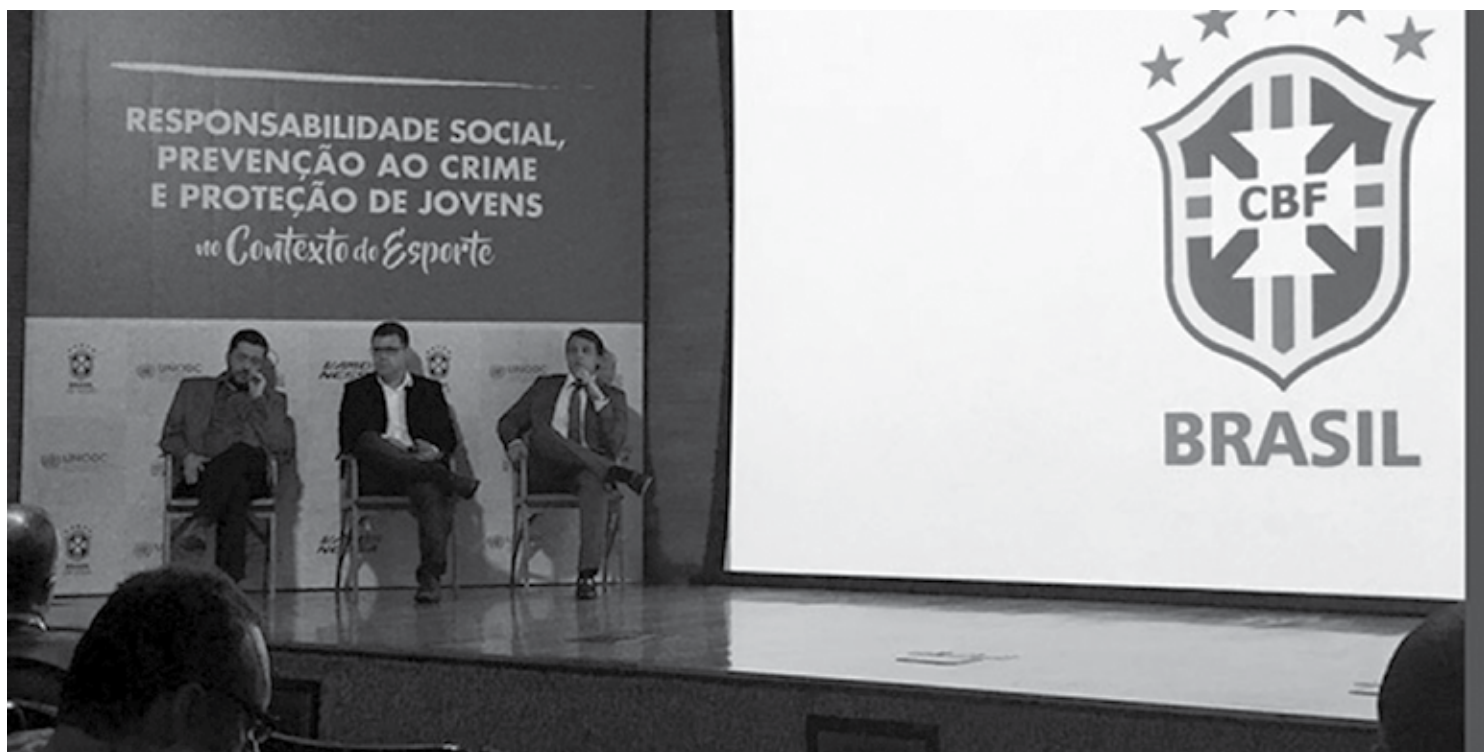
Autoridades do Ministério do Esporte e da Confederação Brasileira de Futebol apresentaram o projeto em diversas modalidades para ajudar os jovens