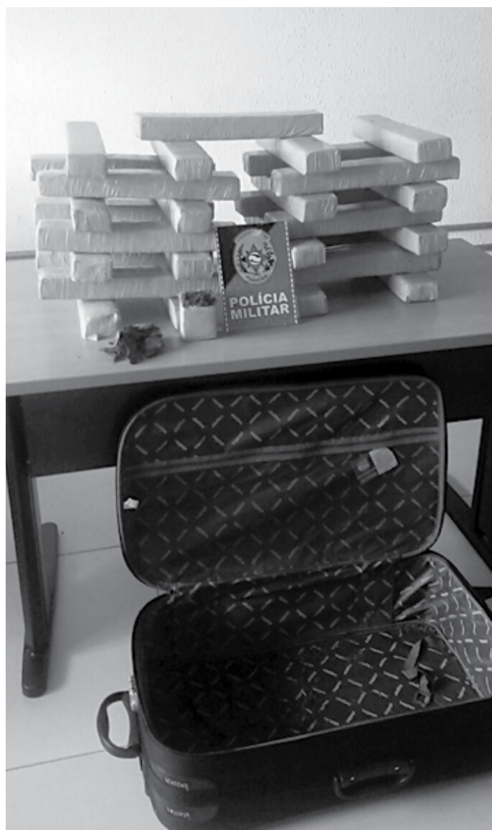
A maconha apreendida estava dentro de uma mala de viagem