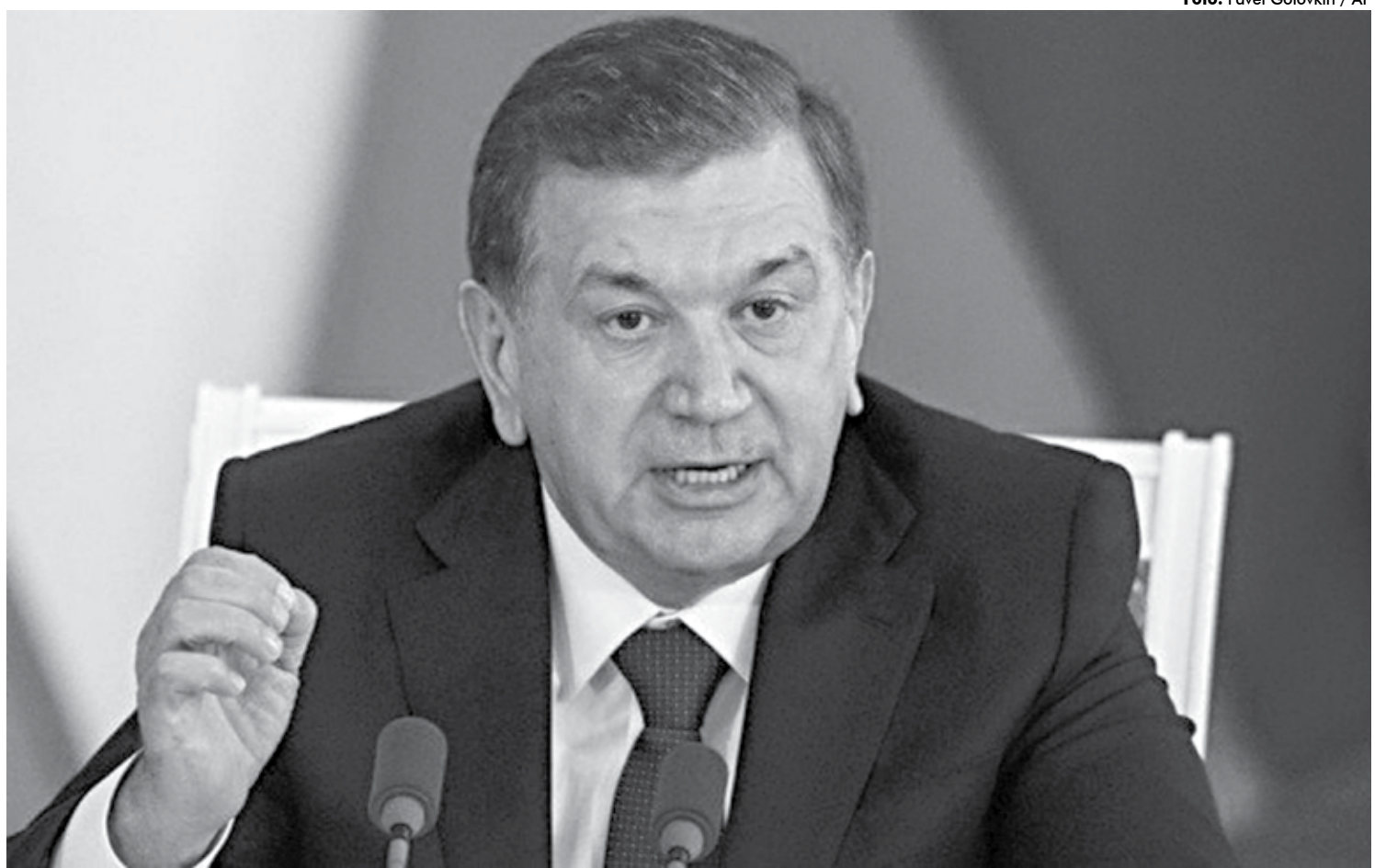
Shavkat Mirziyoyev, atual presidente uzbeque, fez a oferta ao governo norte-americano após a divulgação de que o suspeito do ataque é do seu país

A rede CNN e outros veículos de mídia norte-americanos disseram que Saipov deixou uma nota dizendo que cometeu o atentado em nome do Estado Islâmico e que gritou Allahu Akbar (Deus é grande) em árabe - ao saltar da caminhonete. Ele emigrou para os EUA em 2010 e morou na Flórida, segundo outros canais de mídia.