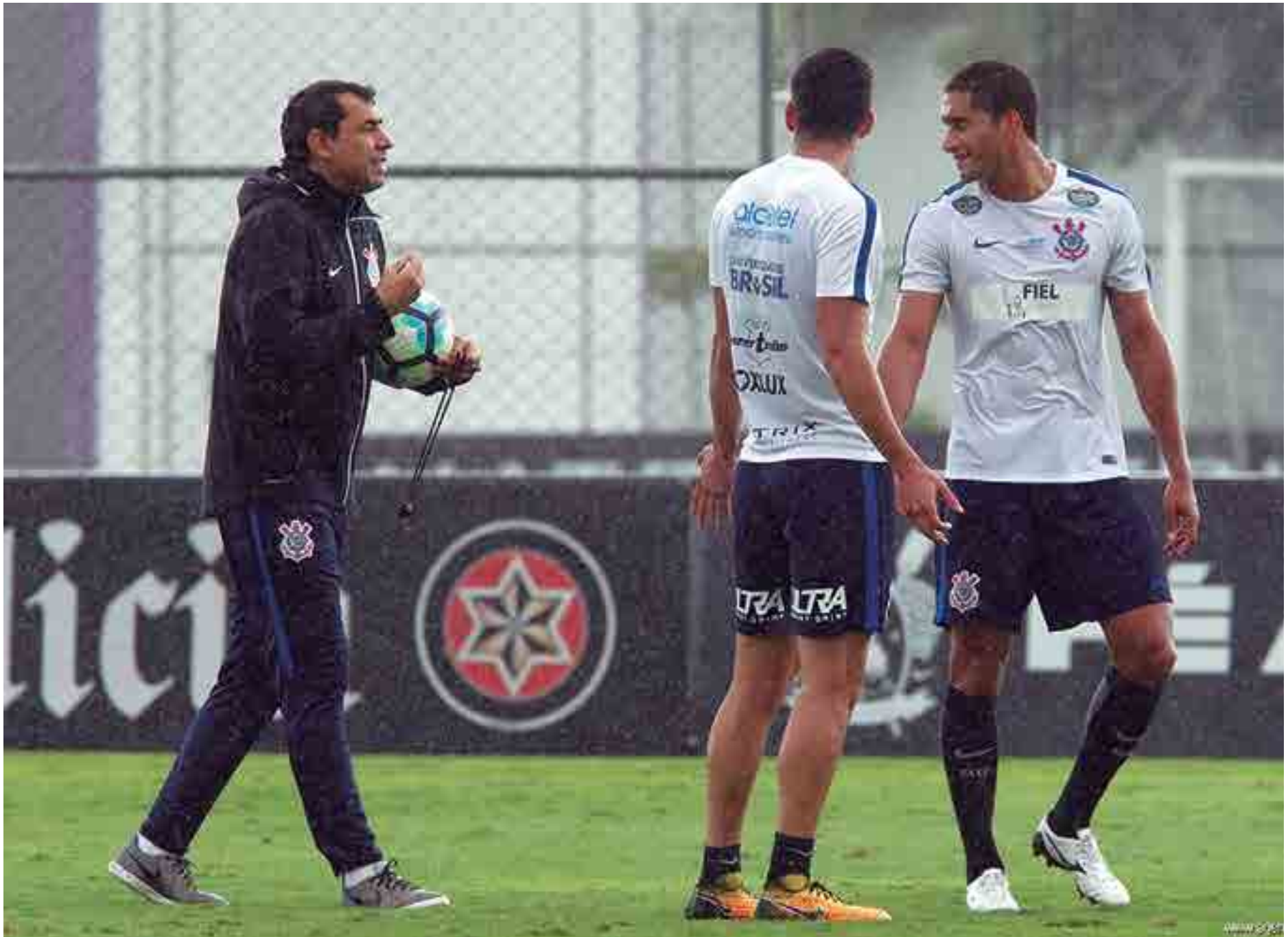
O técnico do Corinthians está testando variações táticas para o jogo contra o Palmeiras no próximo domingo na Arena do clube. A equipe faz uma campanha bisonha no segundo turno

Os testes ainda não asseguraram a presença da dupla desde o começo da partida,