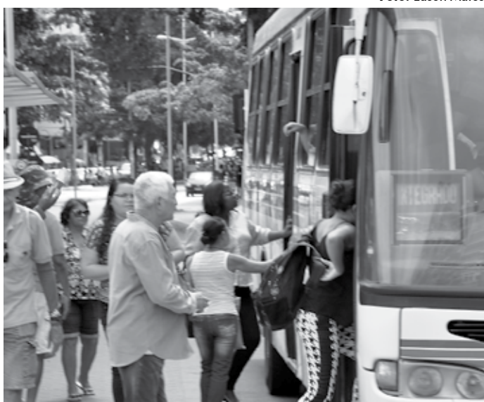
Candidatos vão dispor de mais ônibus no próximo domingo em JP