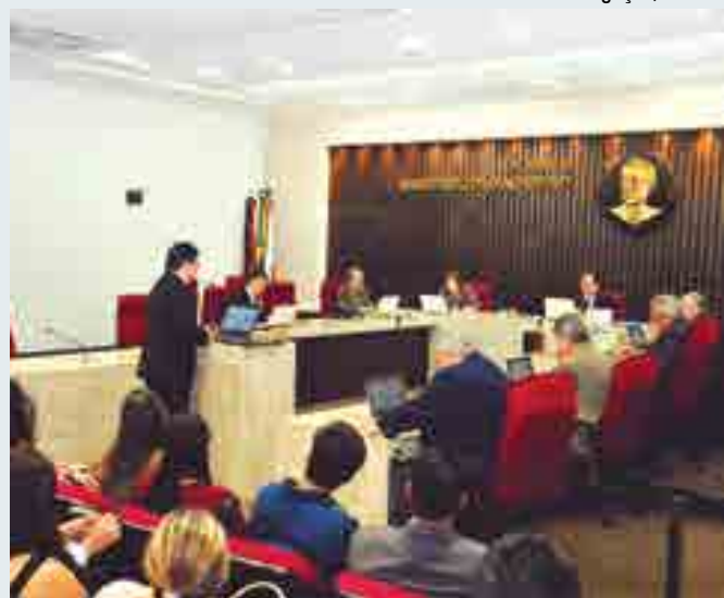
Corte ainda impôs o débito de R$ 208.726,68 ao ex-gestor