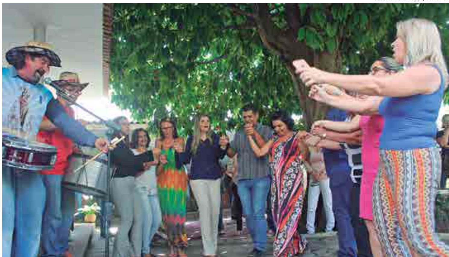
O grupo Charlie Brown e os batuqueiros do Centro de Atenção Psicossocial (Caps AD III – álcool e drogas) participaram da abertura do evento em JP

No Brasil, o câncer de próstata é o segundo mais comum entre os homens (atrás apenas do câncer de pele não-melanoma). Em valores absolutos, é o sexto tipo mais comum no mundo e o mais prevalente em homens, representando cerca de 10% do total de cânceres. Sua taxa de incidência é cerca de seis vezes maior nos países desenvolvidos em comparação aos países em desenvolvimento. Mais do que qualquer outro tipo, é considerado o câncer da terceira idade, já que cerca de três quartos dos casos no mundo ocorrem a partir dos 65 anos.