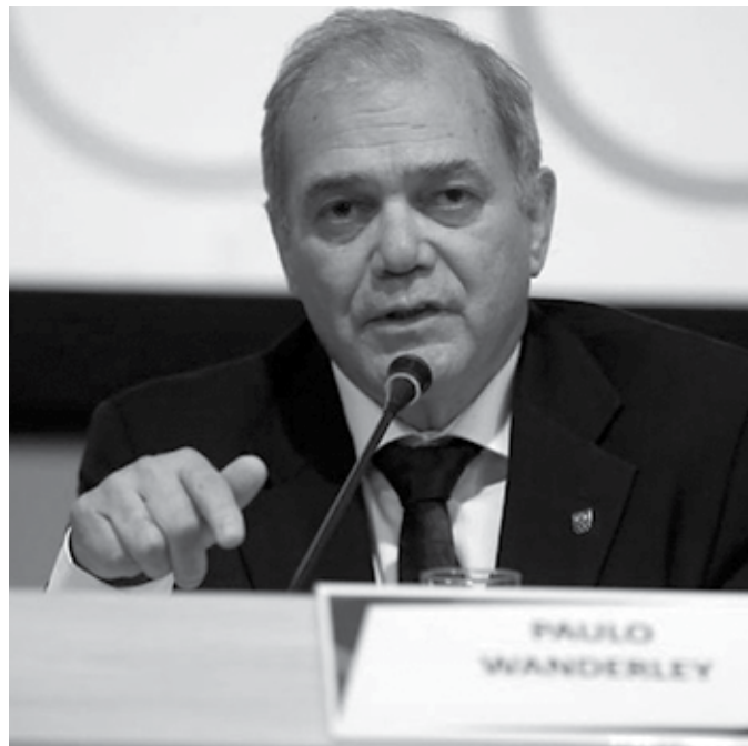
Paulo Wanderley é o atual presidente do Comitê Olímpico Brasileiro

O presidente do COB, Paulo Wanderley Teixeira, agradeceu o reconhecimento do COI. "Agradecemos ao COI pelo reconhecimento das nossas ações até o momento. Continuamos trabalhando firme para conseguir, em um curto espaço de tempo, a conformidade total, através de medidas direcionadas pela austeridade, transparência e mérito", afirmou.