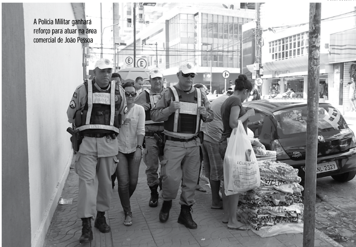
A Polícia Militar ganhará reforço para atuar na área comercial de João Pessoa

Pesquisa de Intenção de Compras para as Festas Natalinas do Instituto Fecomércio de Pesquisas Econômicas e Sociais da Paraíba, divulgada na última segunda-feira, aponta que 61,89% dos paraibanos pretendem manter o costume presenteando alguém e que o Natal é a melhor data em termos de volume de vendas, o que, com certeza, acarretará num grande número de consumidores às lojas comerciais,